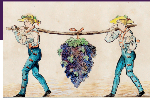
Ausschnitt aus der Lithographie Winserzug in der Hoflößnitz nach Moritz Retzsch, 1840.

Informationen: www.schumstaedte.de | www.hofloessnitz.de